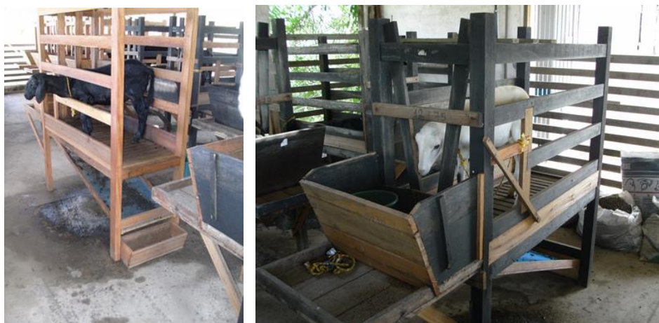
Figura 3: Ovinos Experimentais em Gaiolas Metabólicas na UFRA-Belém.

Cada tratamento recebeu um tipo diferente de genótipo de Capim-Elefante, sendo: Genótipo 1: CNPGL 91-11-2, Genótipo 2: CNPGL 96-27-3, Genótipo 3: CNPGL 96-24-1 e o Genótipo 4: CNPGL 00-1-3, cortados das respectivas parcelas aos 55 dias após o corte de uniformização. A composição química dos genótipos oferecidos aos animais pode ser observada na (Tabela 2).